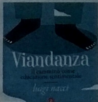
La copertina del libro

La decisione di partire a piedi in una giornata senza lavoro